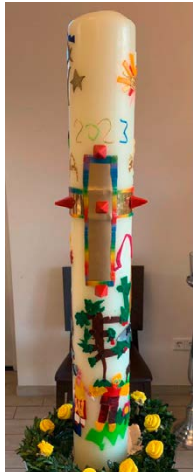
St. Mariä Himmelfahrt