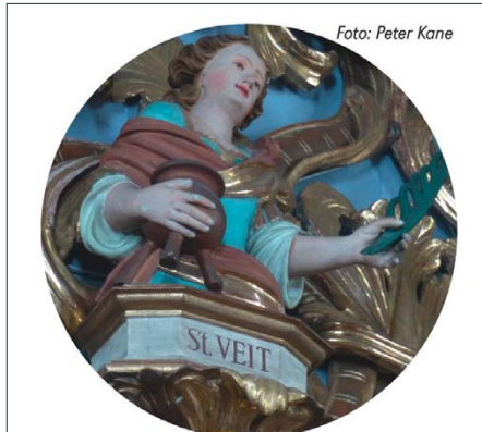
Am 15. Juni gedenkt die Kirche des hl. Vitus, besser bekannt unter seinem übersetzten Namen: Veit. Dieser frühchristliche italienische Heilige gilt als einer der 14 Nothelfer und ist Patron gegen vielerlei Krankheiten.