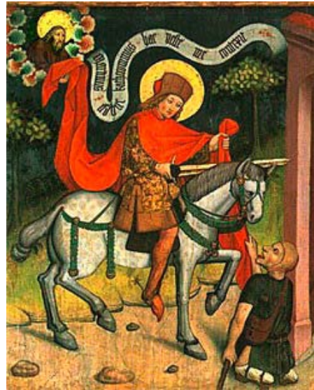
Mantelteilung des heiligen Martin © Diözesanmuseum Rottenburg

1. Lesung: Weisheit 6,12-16 | 2. Lesung: 1. Thessalonicher 4,13-18 | Evangelium: Matthäus 25,1-13