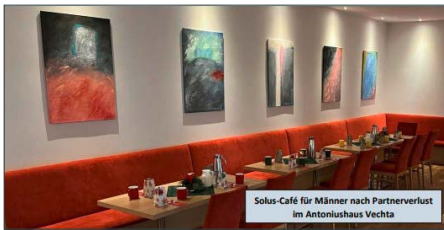
Solus-Café für Männer nach Partnerverlust im Antoniushaus Vechta

Noch nicht Frühling, aber auch nicht mehr Winter!