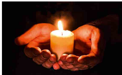
Hands Open Candle - Kostenloses Foto auf Pixabay - Pixabay